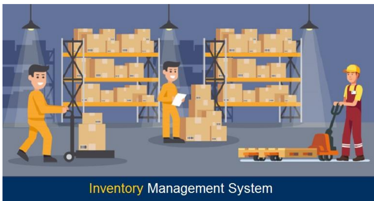
Hệ thống quản lý Kho

Quản lý hàng tồn kho nhiều địa điểm là quá trình quản lý hàng tồn kho trên nhiều địa điểm, kho hàng và cửa hàng bán lẻ hoặc trên nhiều kênh bán hàng. Với tính năng quản lý nhiều vị trí, bạn có thể xem lượng hàng trong kho ở tất cả các vị trí và tối ưu hóa hàng tồn kho của mình để đáp ứng các đơn đặt hàng.