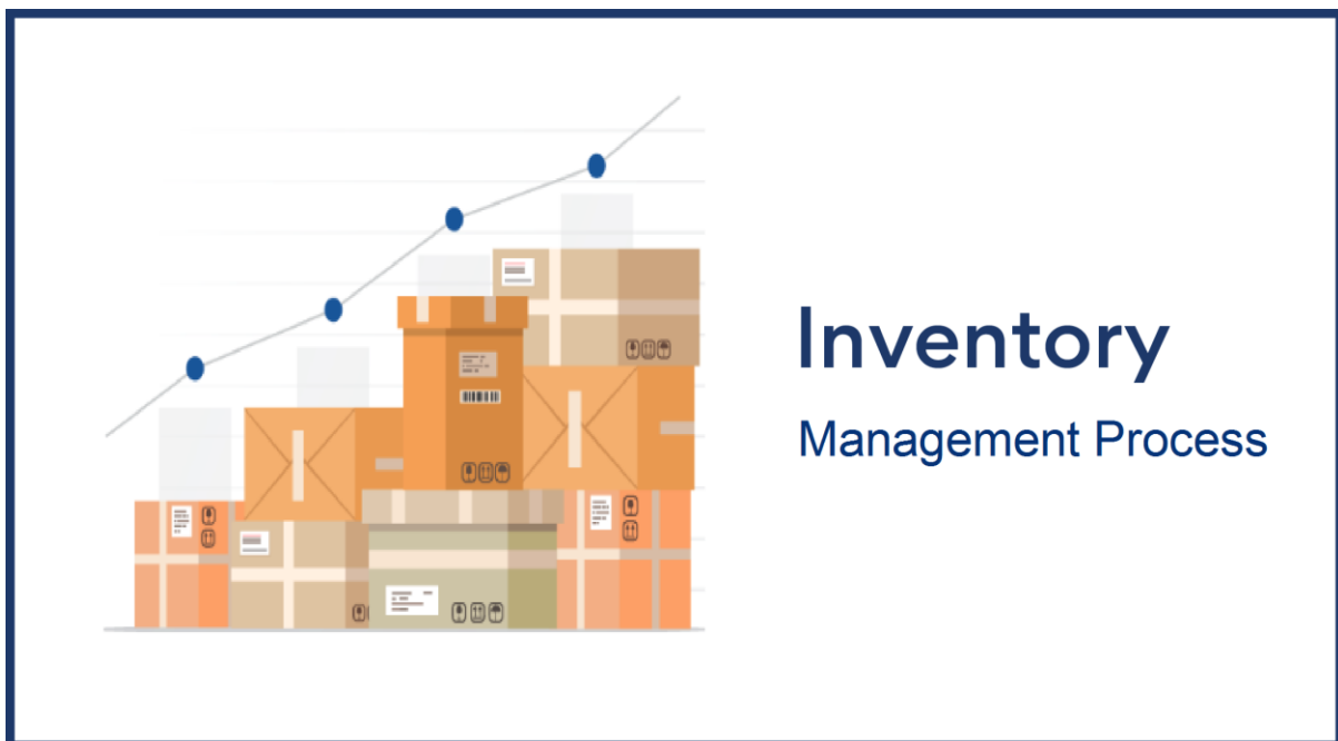
Quy trình quản lý Kho

Bạn có đang chi tiêu nhiều hơn cho việc quản lý và lưu trữ kho so với lợi nhuận được tạo ra? Bạn đang sử dụng quy trình quản lý kho nào để quản lý kho? Bạn có hệ thống quản lý kho không? Nếu bạn chưa có câu trả lời cho những câu hỏi này, chúng tôi có thể giúp bạn hiểu cách quản lý cũng như một số công cụ tốt nhất để sử dụng và những lợi ích bạn có thể mong đợi.